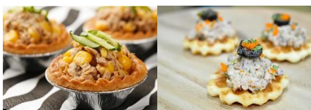
玉米鮪魚塔 Corn & Tuna Fish Tart