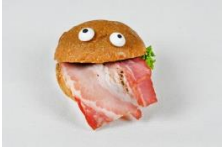
調皮鬼 培根迷你漢堡 Naughty Ghost Mini Bacon Cheese Hamburger

(棉花糖內含明膠為葷食 Marshmallow Fondant Contains Gelatin, Not Vegetarian Food)