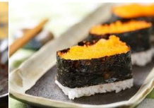
魚卵握壽司 Roe Sushi