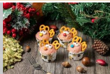
馴鹿藍莓杯子蛋糕 Christmas Reindeer Cupcake