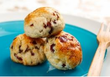
蔓越莓迷你司康 Cranberry Scone