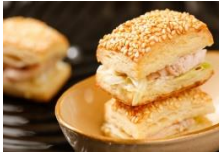
迷你燻雞歐式燒餅 European-Style Smoked Chicken Biscuits