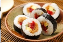
海苔壽司 Nori-Moki Sushi