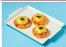
迷你夏威夷披薩 Mini Hawaii Pizza