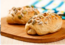
黑糖乳酪堅果麵包 Brown Sugar Cheese & Nuts Bread