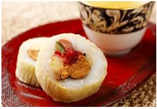
花壽司 Nakamaki Sushi