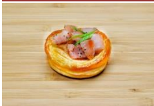
台式香腸丹麥籃 Taiwanese Sausage Savoury Danish Pastry