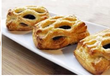
藍莓格子烤派 Blueberry Danish Pastry