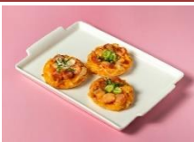
迷你台式香腸披薩 Mini Taiwanese Sausage Pizza