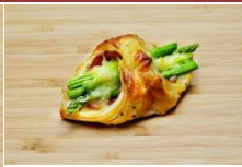
蘆筍培根丹麥捲 Asparagus & Bacon Savoury Danish Pastry