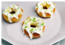
檸檬糖霜丹麥 Danish Pastry with Lemon Glaze