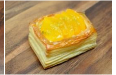
水蜜桃丹麥盒 Peach Danish Pastry Box