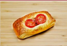
黑胡椒鮪魚丹麥 Tuna Savoury Danish Pastry