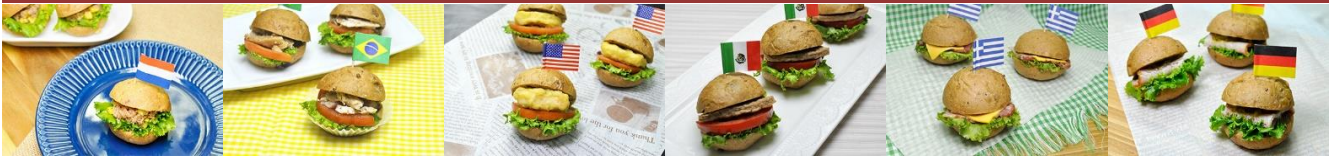
迷你鮪魚漢堡 Mini Tuna Hamburger