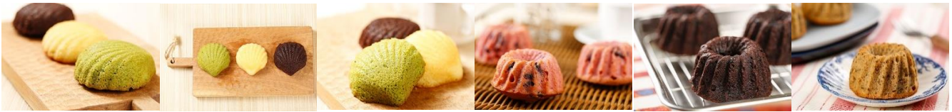
原味馬德蓮 Madeleine Cake