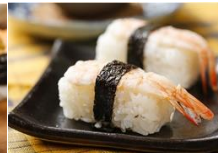
沙蝦握壽司 Shrimp Sushi