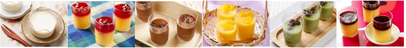
本土小農鮮奶酪(葷) Panna cotta Meat Food