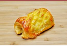
陽光鳳梨燻雞 丹麥捲 Pineapple & Smoked Chicken Savoury Danish Pastry