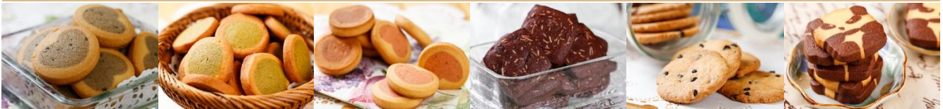
薰衣草小西餅/單片 Lavender Cookies (30個點心可換一籃)