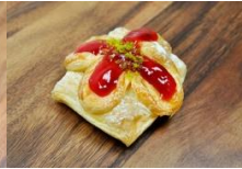
櫻桃丹麥花籃 Cherry Jam Danish Pastry