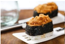
肉鬆握壽司 Pork Floss Sushi