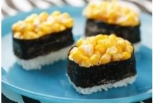
玉米握壽司 Corn sushi