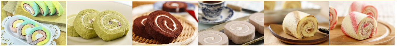
彩虹瑞士捲 Rainbow Cake Roll