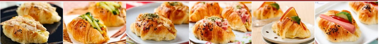
燻雞可頌 Corn & Tuna Croissant