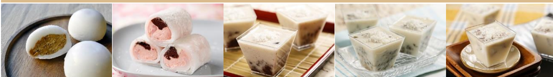
日式大福 Mochi Ice Cream