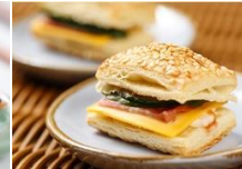
迷你芝士火腿 歐式燒餅 European-Style Cheese & Ham Biscuits