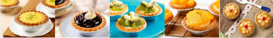
法式檸檬小塔 Lemon Tart