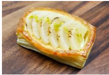
洋梨丹麥盒 Pear Danish Pastry