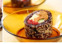
養生紫米捲 Vegetarian Black Glutinous Rice Roll