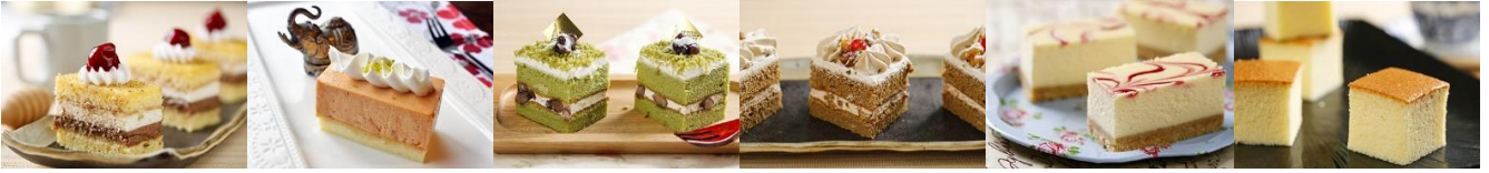
法式聖馬可蛋糕 Saint-Marc Cake