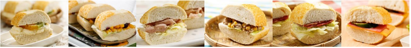
迷你水果潛艇堡 Fruit Mini-Subs