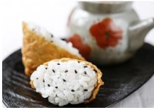
豆皮壽司 Inari Sushi