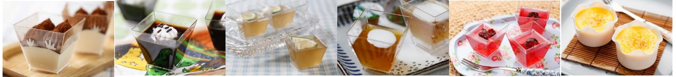
提拉米蘇杯(葷) Tiramisu Meat Food