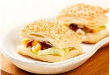
迷你田園歐式燒餅 European-Style Vegetable Biscuits