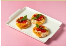
迷你瑪格麗特披薩 Mini Margherita Pizza