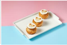
熊寶貝泡芙 Baby Bear Marshmallow Fondant Puffs