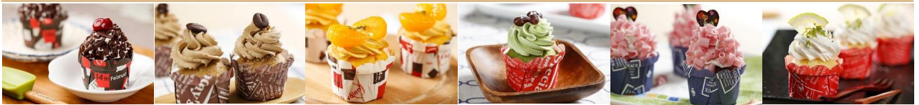
酒漬櫻桃巧克力 杯子蛋糕 Wine-Steeped Cherry with Chocolate Cupcake