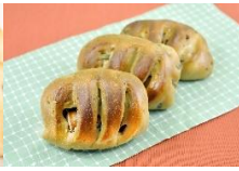
德式香腸麵包 German Sausage Bread