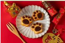
虎掌馬德蓮 Tiger Palm Madeleine Cake