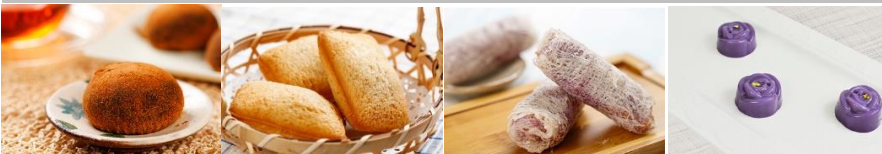
手作黑糖麻糬 Black Sugar Mochi