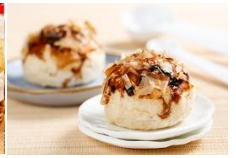
柴魚海苔燒 Dried Bonito Flakes & Seaweed Paste Bun