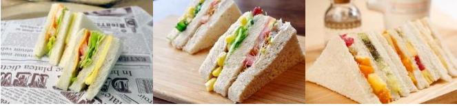
花生醬時蔬三明治 Veggie Peanut Butter Sandwich