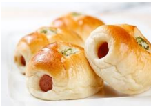
香蔥小熱狗 Mini Hot Dog Bun