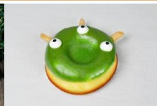
三眼怪抹茶甜甜圈 Squeeze Toy Aliens Doughnuts