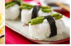
蘆筍握壽司 Asparagus Sushi