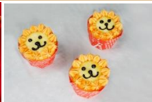
小獅王 檸檬杯子蛋糕 Simba Cupcake