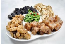
台灣鹹酥雞拼盤 Taiwanese Fried Chicken Platter (40個點心可換一盤)