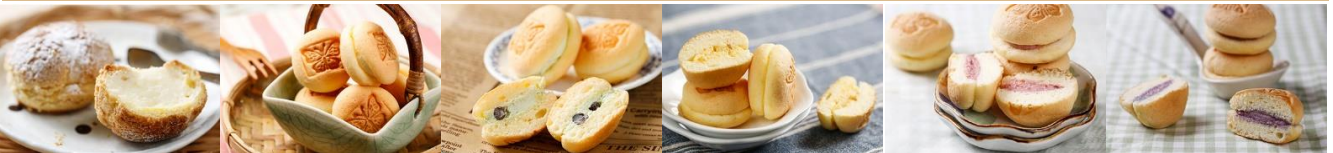
奶油脆皮小泡芙 Mini Cream Puff