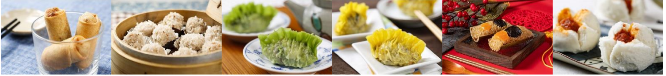
炸春捲 Deep-Fried Spring Roll