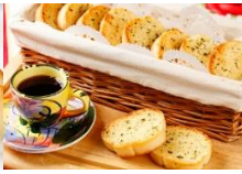
法式香蒜麵包籃 Garlic Bread Basket (25點心可換一籃)