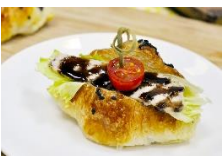
法式嫩雞佐 巴沙米可醋可頌 Herbed Balsamic Chicken Croissant