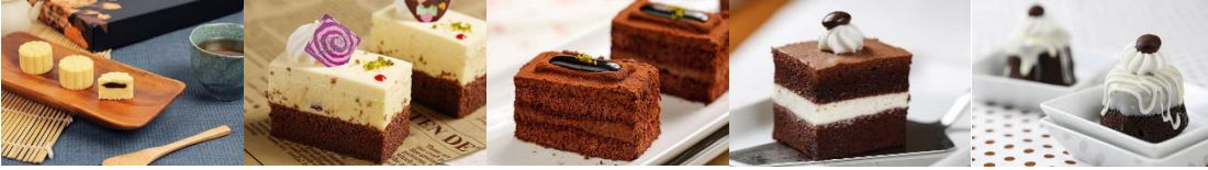
蘭陽狀元御用冰糕 全素 紅豆口味 Lan Yang Ice Mung Bean Cake