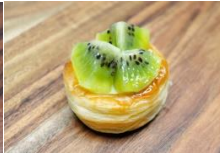
奇異果丹麥籃 Kiwi Danish Pastry