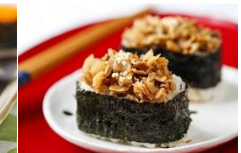
干貝唇握壽司 The Scallops Lip Sushi