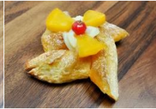
水蜜桃風車丹麥 Peach Danish Pastry