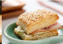
迷你培根歐式燒餅 European-Style Bacon lettuce Biscuits