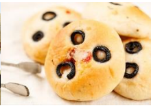
黑橄欖佛卡夏麵包 Mini Olive Focaccia