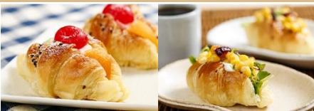
水果可頌 Fruit Croissant