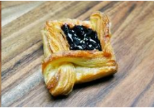
藍莓菱格丹麥 Blueberry Jam Danish Pastry