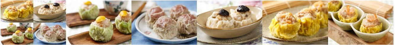
綜合燒賣 Assorted Shao Mai