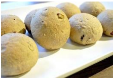
雜糧小餐包 Mini Multi-grain Bread