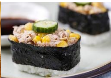
鮪魚沙拉握壽司 Tuna Salad Sushi