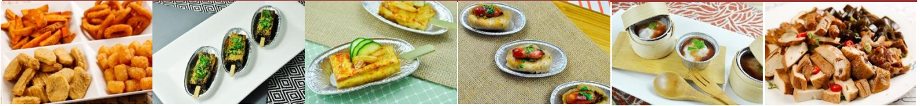
美式炸物拼盤 American Style Dep-fried Platter (48個點心可換一鍋)