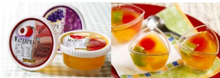
QQ水果凍 Fruit Jelly