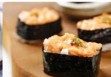
龍蝦沙拉握壽司 Lobster Salad Sushi