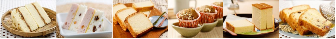
古早味鹹蛋糕(葷) Taiwan-Style Salty Cake Meat Food