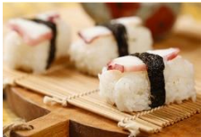
章魚握壽司 Octopus Sushi