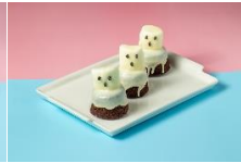
幽靈布朗尼 Ghost Brownie