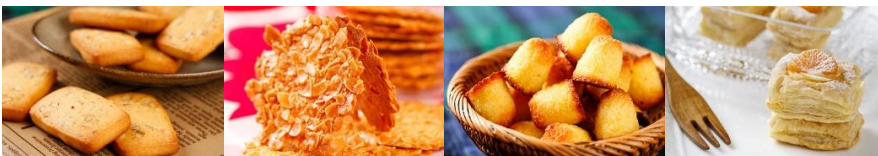
杏仁核桃餅乾/單片 Almond & walnut Cookies (30個點心可換一籃)