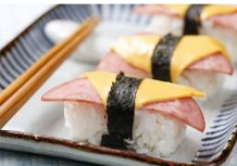
芝士火腿握壽司 Cheese & Ham Sushi