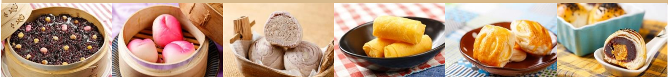
素黑珍珠丸 Vegetarian Black glutinous rice Ball