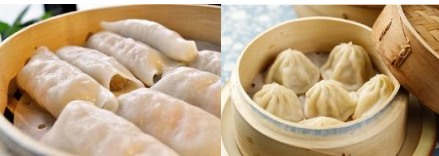
蝦仁河粉 Cheong Fun (Rice Noodle Rolls) With Shrimp