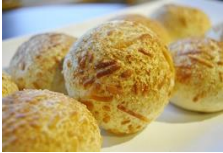
帕馬森起司麵包 Parmesan Cheese Bun