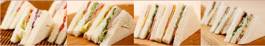
燻雞三明治 Smoked Chicken Sandwich