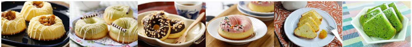
原味核桃 甜甜圈蛋糕 Original Walnuts Donut Cake