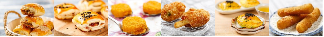
起酥雞肉派 Chicken Pie