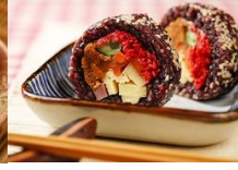
紫米壽司 Black Glutinous Rice Sushi