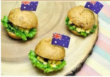
迷你田園漢堡 Mini Vegetable Club Hamburger