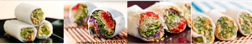
粉皮蘆筍捲 Rice Noodle Asparagus Rolls