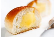
爆漿奶油餐包 Custard Filled Cream Bun