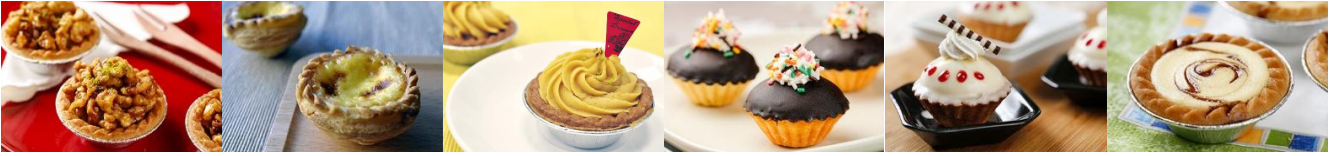
乾果塔 Walnut Mini Tart